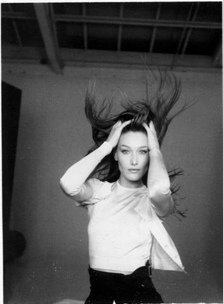
CARLA BRUNI for L'Officiel, Paris 1994