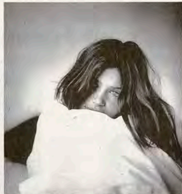
BEFORE: TAMM