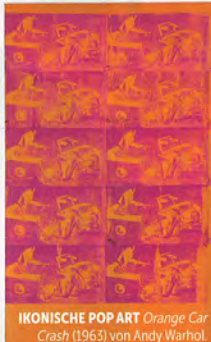
IKONISCHE POP ART Orange Car Crash (1963) von Andy Warhol.