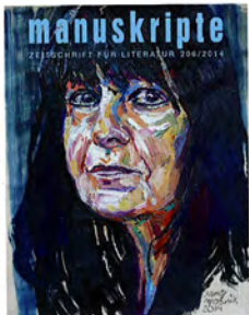
Titelbild: Franz Vang-Macchia

LITERATUR. Wir freuen uns auf die Präsentation der neuen „manuskripte“ am 4. Dezember 2014 um 19 Uhr im Schauspielhaus Graz. Wie das Titelbild der Zeitschrift für Literatur schon verkündet, gibt es darin unter anderem einiges von und über Friederike Mayröcker zu lesen, die am 20. Dezember ihren 90. Geburtstag feiert! www.manuskripte.at