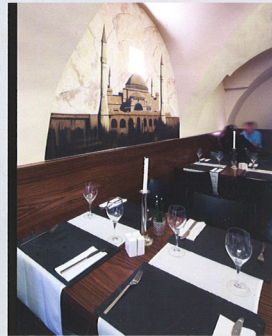
PERSIEN TRIFFT GRAZ S.24